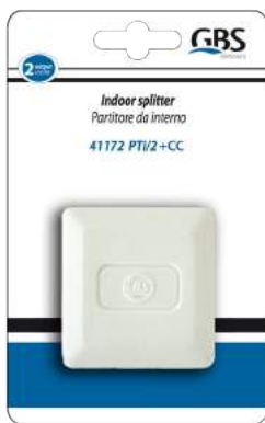
Imballo 13 x 17 x 5 cm Confezione 120 pz.