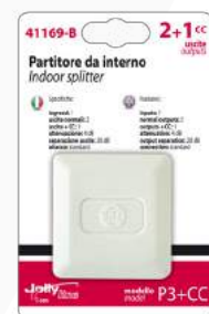
Imballo 13 x 17 x 5 cm