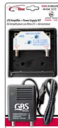
Imballo 13 x 30 x 6 cm Confezione 20 pz.