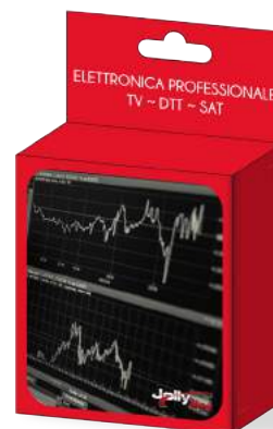
Imballo 10 x 12 x 6 cm Confezione 25 pz.