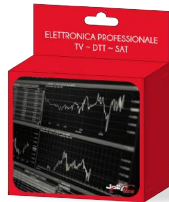
Imballo 14 x 12 x 5 cm Confezione 25 pz.