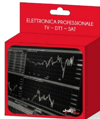
Imballo 14 x 12 x 5 cm Confezione 25 pz.