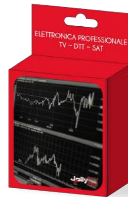
Imballo 10 x 12 x 6 cm Confezione 25 pz.