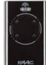
XT4 433 SLH BLACK