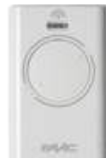
XT2 433 SLH