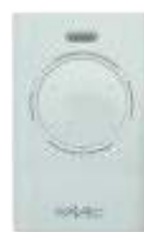
XT4 433 SLH