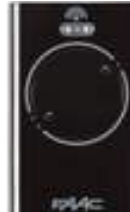
XT2 433 SLH BLACK